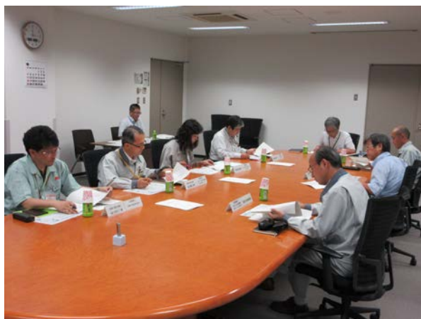
第76回活動推進幹事会

第76回活動推進幹事会では、議題（1）から（9）まで説明が行われ、下期活動計画並びに東海ノア通信第65号の発行が承認されました。