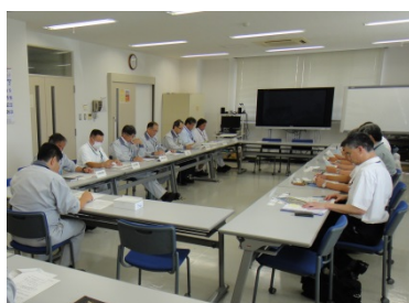
大洗研究開発センター

点検実施協力者からの自主保安点検活動結果として、「安全確保を最優先に、現場を重視した保安活動や経営層と現場のコミュニケーションの推進、安全作業ハンドブックの配備など、所員一人ひとりが業務に関する法令やルールを遵守し、現場目線で活動に取り組んでいる。」、「現場の4S活動がしっかり行われている。」、「作業責任者の資格認定制度が設定され、保安立会者及び現場責任者への教育・訓練が徹底されている。」などの感想が述べられました。